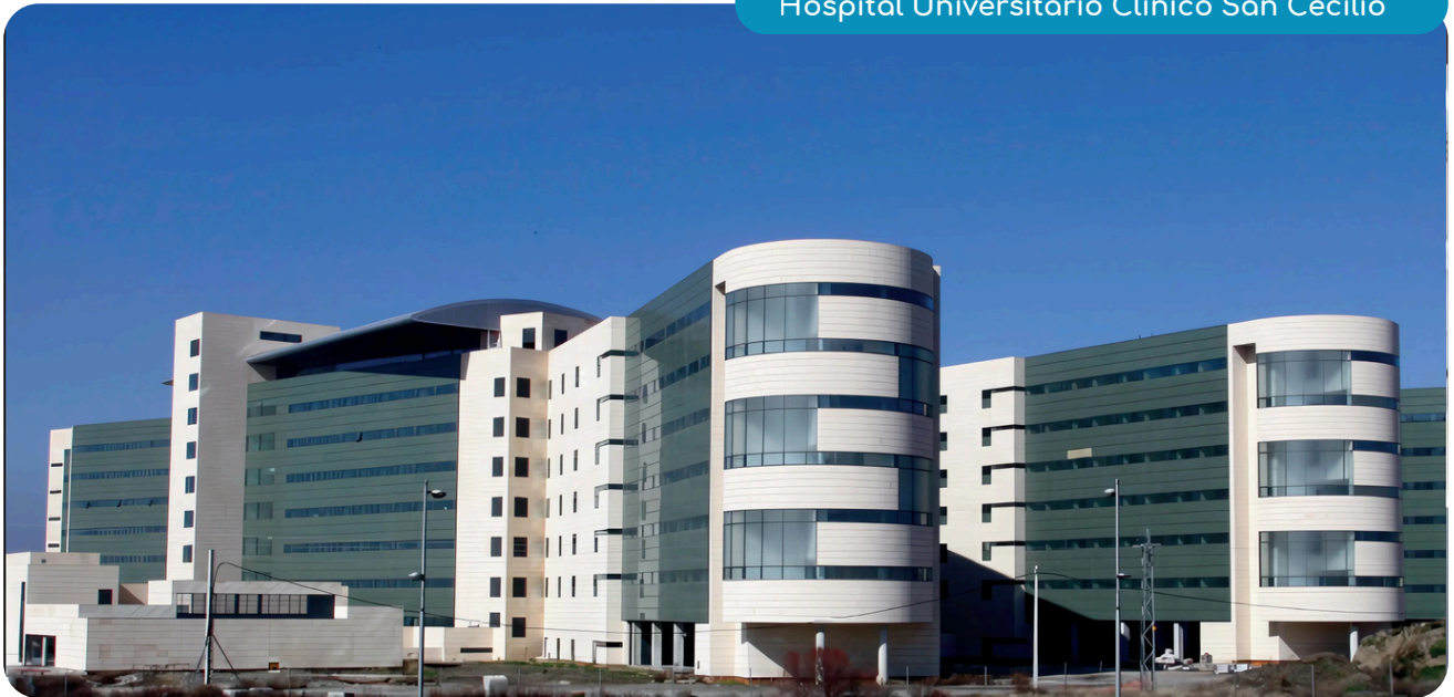
Hospital Universitario Clínico San Cecilio

Esta cercanía permite una atención médica eficiente y oportuna, contribuyendo al bienestar general de la comunidad.