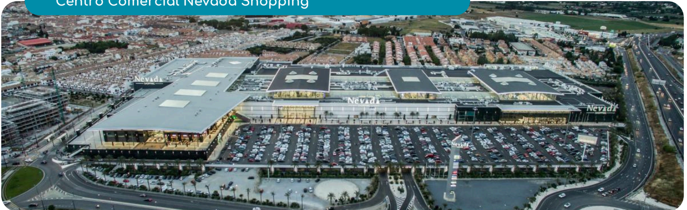
Centro Comercial Nevada Shopping

Asimismo, la Ciudad Deportiva de la Diputación de Granada , situada en Armillá, es el mayor complejo polideportivo público del área metropolitana. Inaugurada en 1978, se extiende sobre más de 18 hectáreas y ofrece una amplia gama de instalaciones y modalidades deportivas.